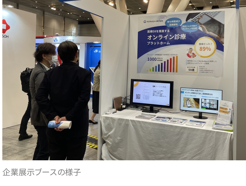
企業展示ブースの様子

このファクトは、日本イーライリリー株式会社様や田辺三菱製薬株式会社様からの情報を得ており、日本で1位という信頼はお客様のファクトです。