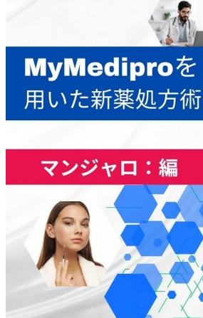
MyMediproを用いた新薬処方方 マンジャロ編 Kindle版 鈴木吉彦 (著)

HDCアトラスクリニックは、日本でトップ人数である300名の糖尿病患者に対して、ほぼ負担なく安定供給を実現。そのノウハウは、Kindle書店で電子書籍として公開されています。クリニック内の診療はスムーズに運営され、新薬処方方の条件期間を無事に乗り越えました。