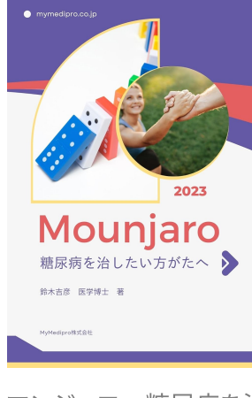
マンジャロ 糖尿病を治したい方がたへ Kindle版 鈴木 吉彦 (著)