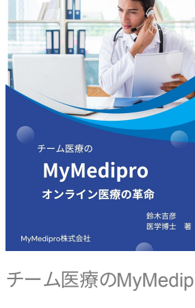
チーム医療のMyMedipro オンライン医療の革命 Kindle版 鈴木吉彦 (著)