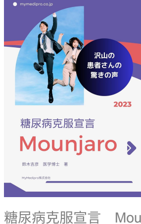
糖尿病克服宣言 Mounjaro: 沢山の患者さんの震きの声 Kindle版 鈴木吉彦 (著)