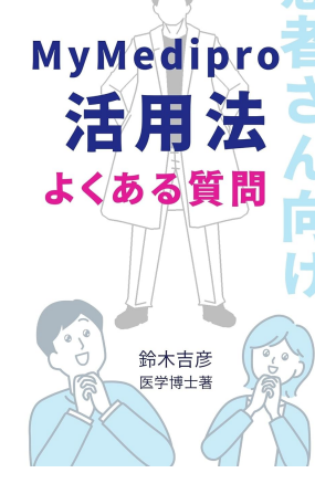
MyMedipro活用方法よくある質問 患者さん向け Kindle版 鈴木吉彦 (著)

学会の展示ブースでも多くの関心を集め、MyMediproからのマンジャロの処方量は、発売以来1医療機関として常に1位を維持しています。