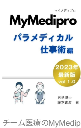
チーム医療のMyMediproパラメディカル仕事術編 Kindle版 鈴木吉彦 (著)